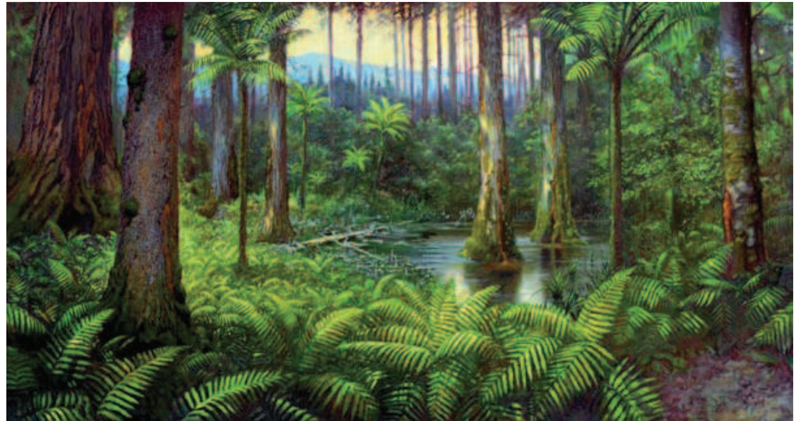
1 Las bursztynowy wg Krzysztofa Buczaka The amber forest as depicted by Krzysztof Buczak

The exhibition's main component is a diorama: Poland's first life-size three-dimensional model of the amber forest. The 52 m 2 exhibit presents the story of Baltic amber – from liquid resin, forming