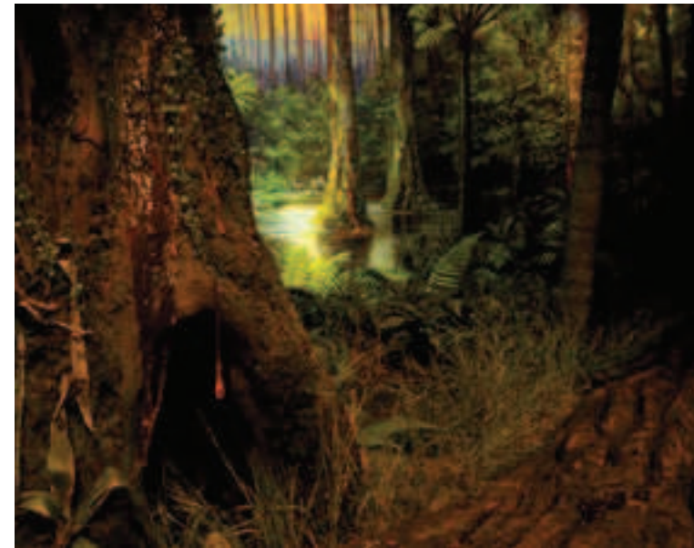
4 Fragment dioramy Detail of the diorama