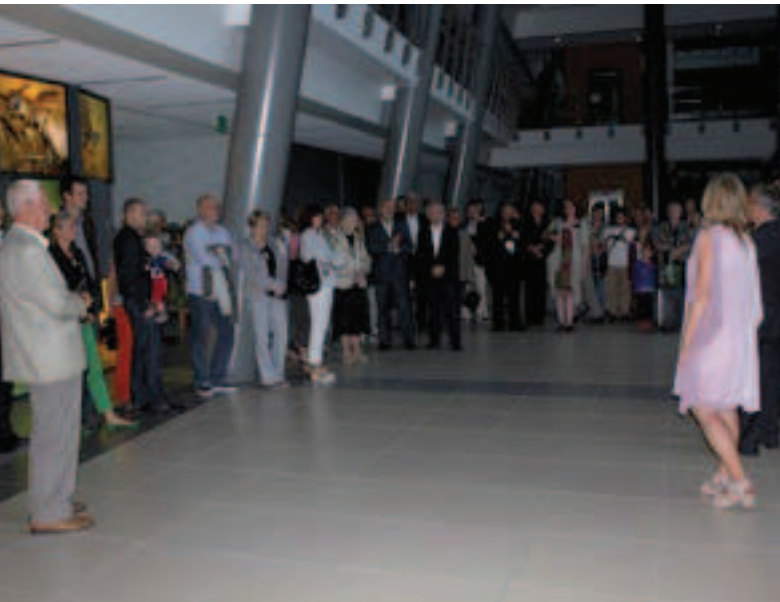
2 Otwarcie ekspozycji „Życie w lesie bursztynowym” Opening of the “Life in the Amber Forest” exhibition