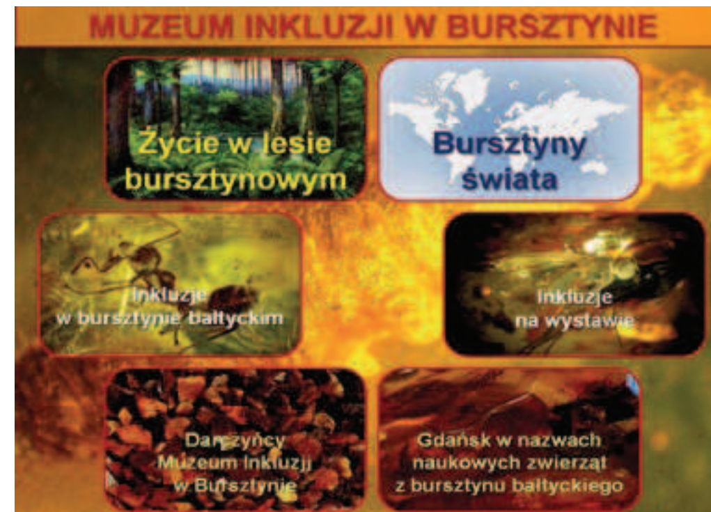
6 Multimedialny przewodnik po wystawie Multimedia exhibition guide

You can visit the exhibition at the Museum of Amber Inclusions every day (except for bank holidays) from 8:00 to 18:00 on the ground floor of the Faculty of Biology in ul. Wita Stwosza 59. Admission is free, groups of over 7 persons are requested to make an appointment by e-mail – bursztyn@biol.ug.edu.pl or telephone +48 58 523 61 80. You can also visit the exhibition without leaving your house at: http://www.wpanoramie.pl/biologiaug/