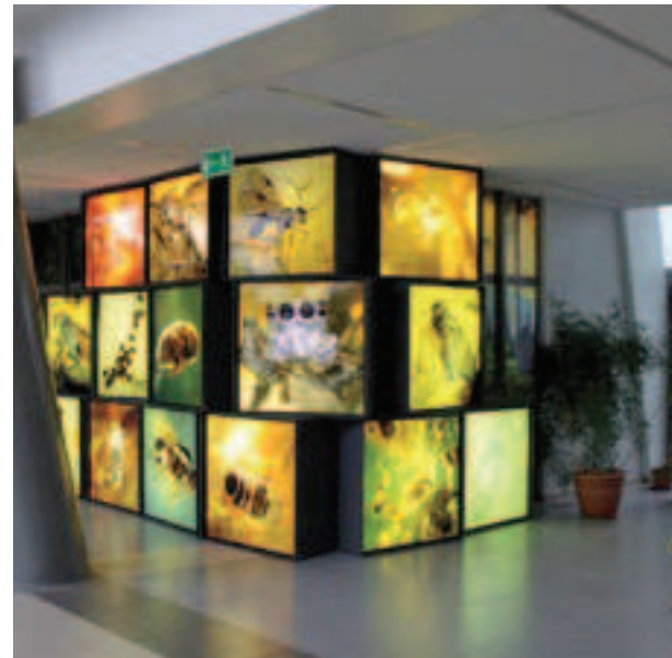
3 Zewnętrzna ekspozycja inkluzji External inclusion display