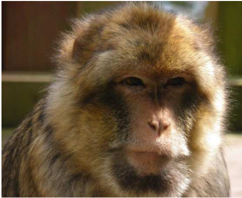
Donkey, makak berberyjski

źródło białka, głównie jaja i mięso. Owoce i orzeszki ziemne to mile widziane przekąski, zawsze wywołujące duże emocje☺