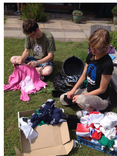
Misterne chowanie przekąsek;)