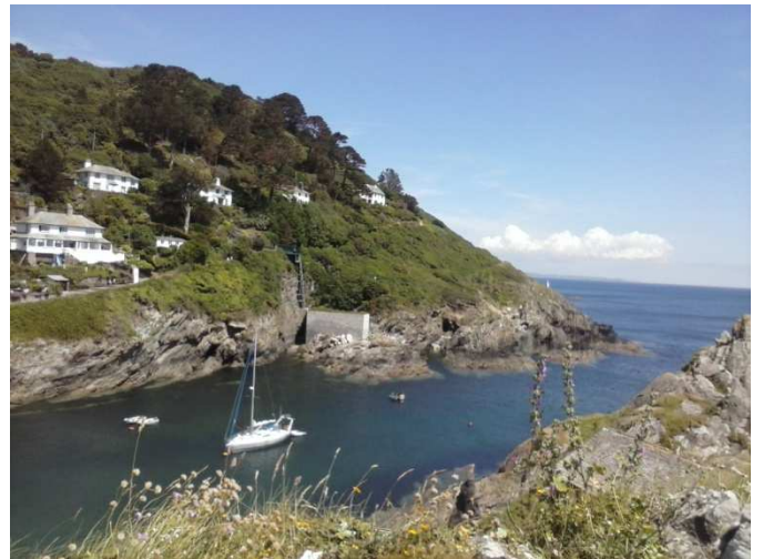
Piękna przyroda wybrzeży Kornwalii

Bardzo inspirująca była dla mnie pasja, z jaką opiekunowie zwierząt wykonują swoją pracę oraz ich życzliwość, dzięki której każdy nowy wolontariusz szybko czuł się, jak u siebie w domu. Ponadto, zaimponowała mi duża świadomość ekologiczna pracowników i ich wysiłki, aby życie i praca Monkey Sanctuary miały minimalny wpływ na środowisko naturalne. Panele słoneczne są źródłem energii do ogrzewania pomieszczeń dla małp (wszystkie pomieszczenia musiały być ogrzewane przez cały rok ze względu na tropikalne pochodzenie zwierząt). Dbano także o zmniejszenie śladu węglowego.