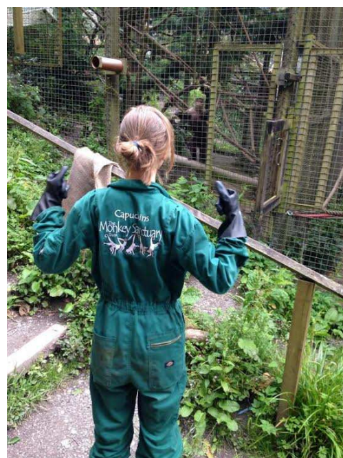
Strój roboczy i pełna gotowość do pracy

Ponadto, do moich zajęć należało przygotowywanie zwierzętom jedzenia. Dieta żyjących tam małp składa się głównie z dużej ilości warzyw oraz nasion i liści. Zostałam więc poinstruowana, jakie liście są dla małp jadalne i jakie smakują im najbardziej, ponieważ codziennie należało wyruszyć na spacer w ich poszukiwaniu. Parę razy w tygodniu zwierzęta otrzymują także