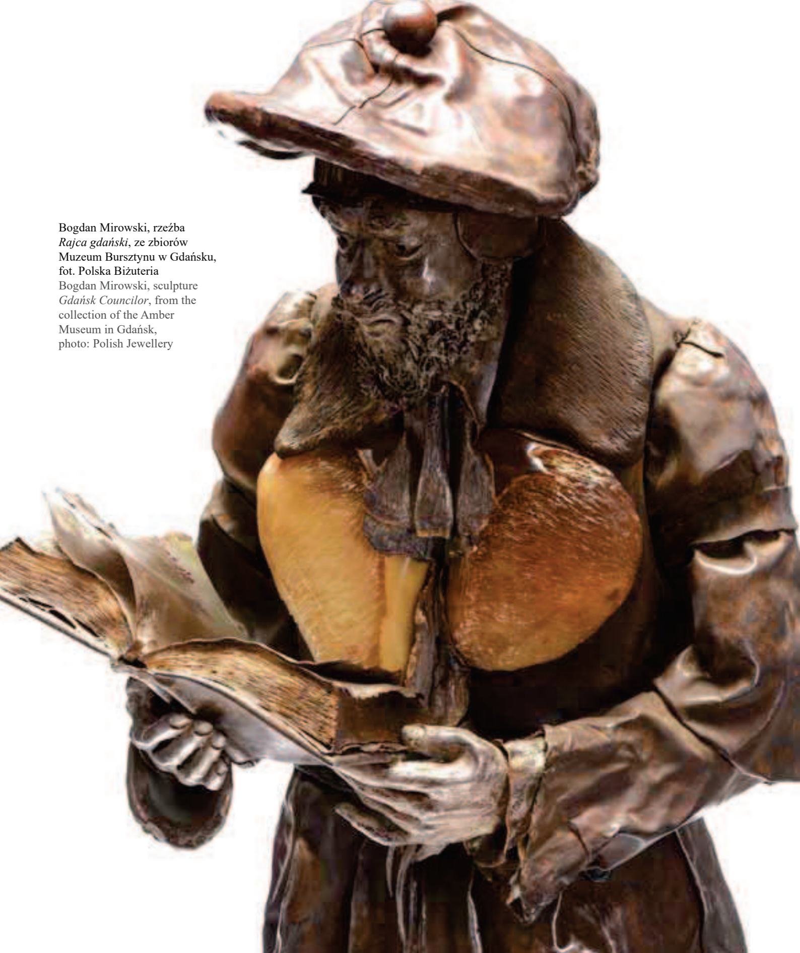
Bogdan Mirowski, rzeźba Rajca gdański , ze zbiorów Muzeum Bursztynu w Gdańsku, fot. Polska Biżuteria Bogdan Mirowski, sculpture Gdańsk Councilor , from the collection of the Amber Museum in Gdańsk, photo: Polish Jewellery