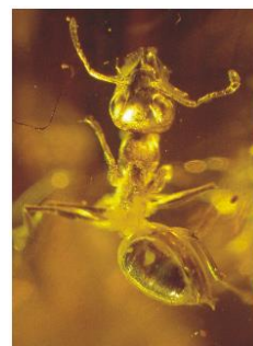
Mrówka zatopiona w bursztynie.

Bilety: 5 zł ulgowy, 10 zł normalny, zniżki dla rodzin